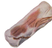
ROSADO 3 A 5 DÍAS