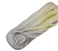
BLANQUECINO 7 A 15 DÍAS