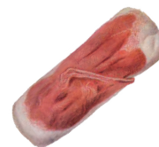
ROJO 1 A 5 DÍAS